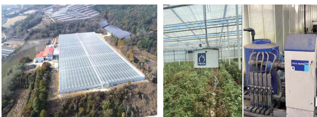
그림 1. 재배 시설 및 수집 장치

이를 보완하기 위해 기온과 상대습도를 기반으로 한 파생 변수들이 활용되고 있으며, 대표적으로 이슬점(Dew Point, T d ), 절대습도(Humidity Density, HD), 수증기압포차(Vapor Pressure Deficit, VPD)가 있다. 이슬점은 응결 발생 가능성, 절대습도는 단위 부피당 수분량, 수증기압포차는 대기의 건조도를 설명한다[3-5]. 특히 수증기압포차는 기온, 상대습도만으로는 작물 생육과의 연결성이 부족하여 두 변수를 통합한 수증기압포차를 통해 작물 수분 스트레스와 증산 작용을 직접적으로 반영하는 핵심 변수로 주목받고 있다. 본 연구는 전북 지역 장미 재배 온실 데이터를 활용하여 이슬점, 절대습도, 수증기압포차를 산출하고, 기존 환경 변수와의 관계를 분석하여 기초적인 연구적 의미를 검토하고자 한다.