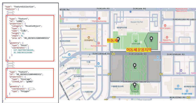
그림 1. 경비안전 객체 구조 및 생성 예시

그림 1은 임무 객체 중 이동체 객체의 구조를 예시로 제시하며, 실외 지도 상에 생성된 GeoJSON 객체의 구성 방식을 보여준다.