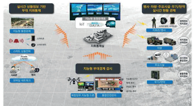
그림 2 지능형 스마트 부대의 기본 운영 개념

둘째, 5G 특화망이 직면할 수밖에 없는 단절·간헐적 연결·대역폭제한 환경의 극복이다. 전장에서는 지형적 요인, 전자전 공격, 기상 상황 등에 의해 통신이 단절되거나 간헐적으로만 유지되며, 심지어 제한된 대역폭만 사용할 수 있는 경우도 빈번하다. 이러한 상황에서 기존의 연속적 연결에 의존하는 네트워크는 제대로 기능하기 어렵다. 따라서 데이터를 저장했다가 재연결 시 전송하는 저장-전송(store-and-forward) 방식, 임무의 중요도에 따라 데이터 전송 우선순위를 부여하는 QoS 정책, 그리고 엣지 컴퓨팅을 통한 현장 분석 기능이 필수적으로 도입되어야 한다. 예를 들어 드론이 촬영한 영상 전체를 전송하는 대신, MEC에서 적의 움직임이나