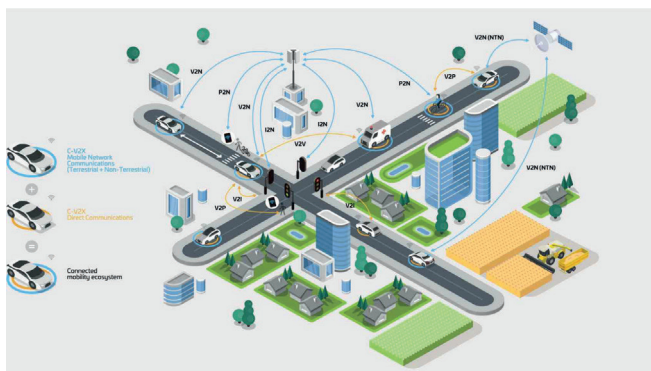
<그림 1> C-V2X(Cellular Vehicle-to-Everything)[1]

차량 통신은 통신 대상에 따라 차량 대 차량(V2V, Vehicle-to-Vehicle), 차량 대 인프라(V2I, Vehicle-to-Infrastructure), 차량 대 네트워크(V2N, Vehicle-to-Network), 차량 대 보행자(Vehicle-to-Pedestrian) 등을 포괄하여 통칭하는 차량 대 만물(V2X, Vehicle-to-Everything) 통신의 영역을 대상으로 한다.[1] 특히 자율주행 자동차의 한계를 보완해 줄 수 있는 기술로 중요한 역할을 하고 있다.