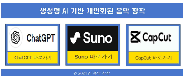
[그림 1] 3AI 통합 플랫폼

최근 생성형 인공지능 기술의 발전으로 인해, 전문가가 아닌 일반 사용자들도 자신만의 음악을 만들어 즐길 수 있는 사회가 만들어지고 있다. 이를 위해 본 시스템에서는 ChatGPT, Suno.AI, CapCut과 같은 생성형 AI 도구들을 통합한 플랫폼을 제안한다. 표 2는 Gen_AI 도구들의 기능적 사용이며, 표3은 AI 기능에서 사용하는 화면이다.