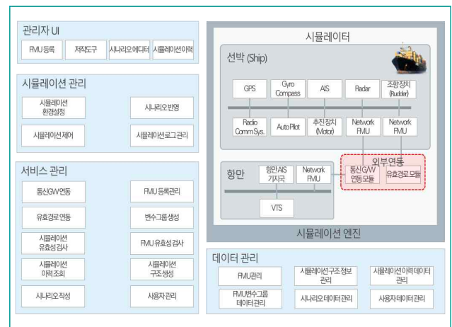
그림 1. 선박 신기술 장비 성능검증 통합 시뮬레이션 플랫폼 설계 구조도

그림 1은 선박 신기술 장비의 성능검증을 위한 통합 시뮬레이션 플랫폼의 전체 설계에 대한 구조도를 도시한 그림이다.