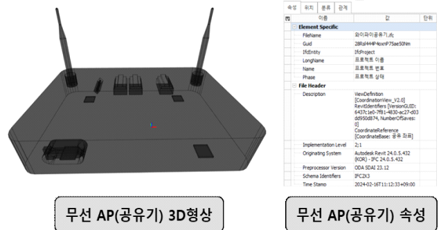
[그림 1] 무선 AP의 BIM라이브러리 형상 및 속성정보(예시)

정보통신설비는 정보를 전달하고, 수집, 가공, 처리할 수 있는 기능을 가진 설비들을 말하며, 연결형태에 따라 유선설비, 무선설비로 나눌 수 있다. 현재 매우 높은 데이터 전송속도나 보안을 요구하는 설비 외의 대부분의 설비 형태는 추가적인 연결공사가 필요하지 않고, 손쉽게 네트워크를 구성할 수 있는 무선형태의 설비가 주를 이루고 있으며 무선설비의 대표적인 설비 중 하나인 무선 AP는 정보통신인프라 구축을 위한 핵심 설비로 다양한 스펙을 가진 무선 AP가 다양한 환경에서 활용되고 있음에 따라 무선 AP의 BIM 라이브러리 속성정보를 정의하고, 활용을 위한 응용 방안에 관한 연구는 정보통신설비 BIM라이브러리의 활용 범위를 넓힐 수 계기가 될 수 있을 것으로 판단되어, 무선 AP에 대한 BIM라이브러리를 개발하고 환경에 따른 데이터 전송 범위에 대한 테스트를 진행하였다.