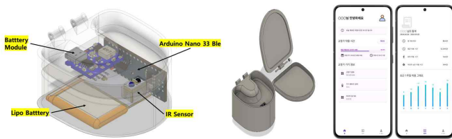
그림 2. 치아 교정 유지 장치 3D 모델링 결과 및 앱 모듈 화면 설계

본 시스템에서 스마트 치아 교정 유지 장치 보관함과 앱 모듈의 주 사용자는 환자 또는 환자의 보호자이다. 서버 모듈의 사용자는 의료진으로 설정하여, 데이터 관리와 환자 관리를 효과적으로 수행할 수 있도록 하였다. 본 논문에서 제안한 시스템의 구조도는 그림 1과 같다.