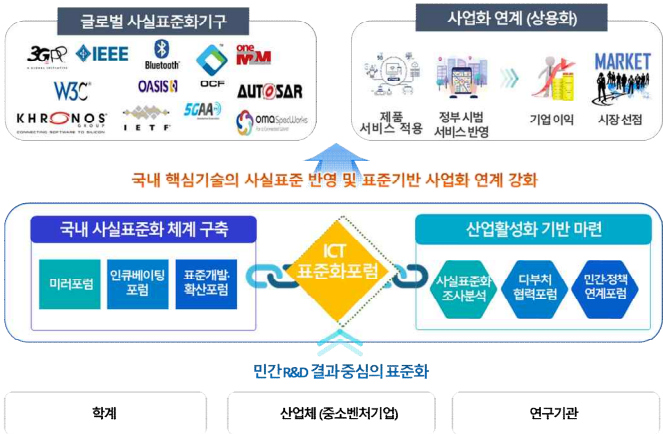
< 그림 1. ICT 표준화포럼 추진 목적 >

본 고에서는 '2024년 ICT 표준화포럼 추진 현황'에 대해 살펴보고자 한다.