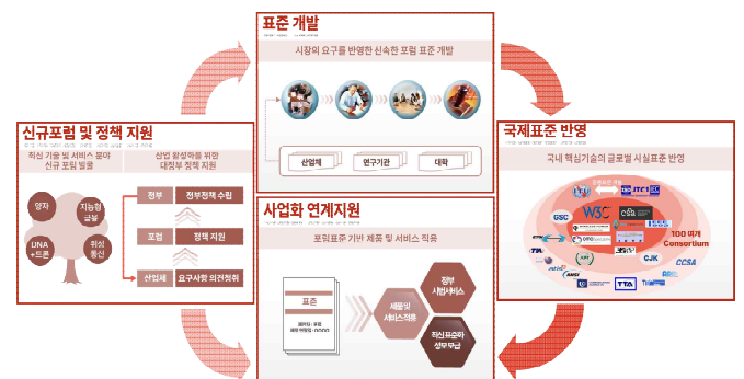
< 그림 5. 포럼 지원의 파급효과 및 활용성 >

ICT 표준화포럼은 ICT 기술성숙도를 고려하여 인큐베이팅 → 국내 표준화(표준개발) → 국제표준화(기공 및 의장단 진출) → 확산·진흥 간 유기적인 활동을 통해 연구개발 성과로 활용할 예정이다. 기술 및 시장 트렌드 변화에 따라 대상을 선정·지원 및 그 결과가 활용되는 과제로써 매년 연구개발 성과 중 사업화로 연계된 우수성과 발굴하고 있다.