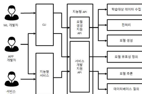
그림 1. 제안하는 API 설계 목록

을 생성하는 역할을 수행한다. 기계 학습 개발자는 서비스 목적에 부합하는 기계 학습 알고리즘을 선정한다. 기계 학습 개발자는 학습대상 데이터의 가공 및 전처리를 수행하여 기계 학습을 수행하고 도출된 학습 모델의 성능 측정 및 재학습을 통한 성능 향상 등 기계 학습과 관련된 다양한 역할을 수행한다. 어플리케이션 개발자는 특정 목적을 가진 지능형 서비스를 개발하는 개발자로 기계 학습 개발자의 역할을 함께 수행할 수도 있지만 기계 학습과 별개로 순수하게 서비스 어플리케이션 개발만을 담당할 수도 있다. 그리고 서비스 사용자는 서비스 개발에 관여하지 않고 지능형 서비스를 이용한다. 제안하는 API 중 모델 생성 지원 API는 인텔리전트 데이터베이스에 저장된 학습대상 데이터와 자원을 이용하여 기계 학습을 수행하고 학습 모델을 생성하는데 필요한 API로 기계 학습 개발자가 주로 활용하게 된다. 그리고 서비스 개발 지원 API는 인텔리전트 데이터베이스에 저장된 데이터와 질의로 입력되는 데이터, 학습 모델을 사용하는데 필요한 API로 서비스를 개발할 때는 어플리케이션 개발자가, 서비스가 이루어질 때는 서비스 사용자가 이용한다. 인텔리전트 데이터베이스 사용자는 CLI(Command Line Interface) 또는 지능형 서비스 클라이언트를 통해 API를 사용한다.