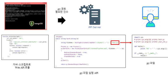
그림 2. 지능형 API 동작 과정 (복잡한 연산의 경우)

본 논문에서 제안하는 API는 몽고 DB 데이터베이스를 기반으로 구현했다. 몽고 DB에는 Stored Procedure라는 개념이 존재하여 자바 스크립트를 데이터베이스 시스템 내에 저장할 수 있다. 그리고 저장된 스크립트는 몽고 DB 셸이나 명령어를 통해서 실행할 수 있다. 하지만 Stored Procedure를 이용하여 실행할 수 있는 스크립트는 자원을 많이 사용하지 않으며, 연산이 복잡하지 않은 작업만을 수행할 수 있다. 따라서 복잡한 기계 학습이나 케라스, 텐서플로우와 같은 기존에 만들어져있는 모델을 불러와서 사용하려는 경우 중간에 Web API 서버를 두어 동작시킨다. 그림 2는 지능형 API 동작 중에서 복잡한 연산을 수행하는 기계 학습 동작을 수행하기 위한 동작 과정을 보여준다. API 서버를 이용하여 동작시키는 경우, 몽고 DB에서는 해당 API를 호출하는 역할만을 수행하고, 실제 동작은 API 서버에서 수행하며 API 서버는 수행된 결과를 몽고 DB에 반환한다. 지능형 API 중에서 모델을 학습하는 동작을 수행하는 모델 생성 API의 대부분은 복잡한 연산과 많은 데이터에 대한 처리로 인해 많은 컴퓨팅 자원이 요구되기 때문에 API 서버를 통한 동작을 수행한다. 반대로 API 서버가 필요하지 않은 간단한 동작은 몽고 DB 자체적으로 저장된 Stored Procedure를 통해 수행한다. 지능형 API 중에서 모델 생성을 제외한 추론이나 데이터 처리 등은 API 서버를 통하지 않아도 동작한다.