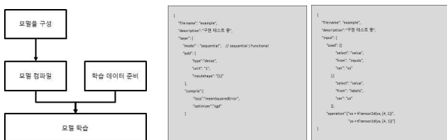
그림 3. 모델 생성 API 그림 4. model_info와 data_info 내용 (예제)

그림 3은 지능형 API 중에 모델 생성 API인 modelCreation()의 동작 과정을 보여준다. modelCreation(model_info, data_info)은 인수로 두 개의 값을 입력받으며, 해당 정보들은 JSON 형태로 기술되어 있다. 그림 4는 입력되는 model_info와 data_info를 보여준다. model_info는 모델 구성 정보를 의미한다. 모델 구성 정보란 레이어를 어떤 형태로 몇 계층을 구성할 것인지 등을 나타내는 정보이다. data_info는 학습 데이터 준비 정보를 의미한다. 학습 데이터 준비 정보란 몽고 DB에 저장되어 있는 원본 데이터를 기계 학습에 입력할 수 있는 데이터 형태로 만드는 과정을 나타내는 정보이다. 해당 파일은 최초 모델을 생성할 때, 한번 입력을 수행하면 추후 성능에 따른 재학습 등을 수행할 때 다시 입력하지 않아도 되기 때문에 지속적인 서비스 제공을 하는 경우, 관리 비용이 감소된다.