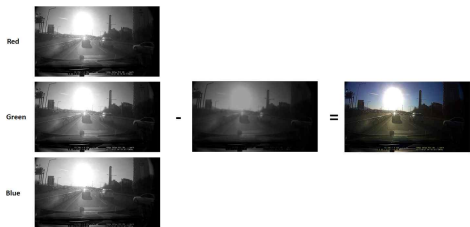
그림 4. 태양광 효과 축소 영상

낮은 밝기값 채널 영상에서 노이즈와 같이 주변 픽셀값들과 비교하여 현저한 픽셀들은 제외하고 나머지 영역들의 픽셀들을 평균값으로 변환함으로써 영상을 부드럽게 변화시킨다. 그림 3 우측 그림은 비등방성 확산 필터링을 적용한 결과 그림이다. 그리고 그림 3의 결과에서 낮은 밝기 값을 가지는 채널을 획득하고 원본 입력 영상의 각 채널과 차이를 계산하여 태양광의 효과를 일부 제거한 영상을 그림 4와 같이 획득한다.