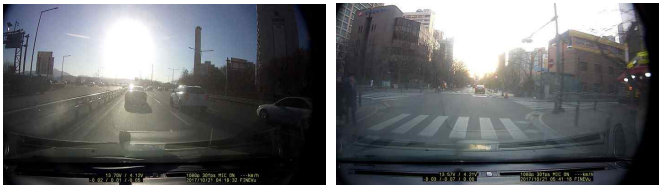
그림 2. 태양광이 포함된 블랙박스 영상

블랙박스에서 획득된 도로 영상에서 낮은 밝기 값 채널을 획득하는 결과는 그림 3과 같다. RGB 칼라 영상에서 태양광과 같이 부가적인 색상 값이 포함된 픽셀값을 다른 색상 채널보다 픽셀값이 높은 것이 사실이다. 따라서 태양광의 영향이 가장 작은 것으로 판단되는 픽셀들의 값들만을 추출하기 위해 RGB 색상 채널의 가장 낮은 픽셀값을 가진 채널값을 획득하여 낮은 밝기값 채널을 획득한다.