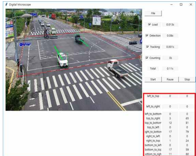
그림 3. 통행량 계수 결과