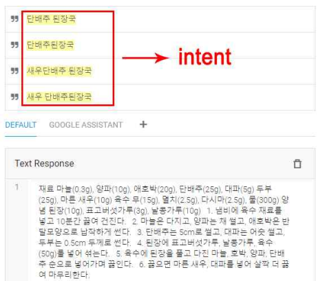
Fig. 3. Intent Training

그림 2와 같이 레시피 챗봇이 사용자의 말을 인식하기 위해서는 의도(intent)를 알아야 한다. 사용자의 다양한 문장 패턴을 받으면 의도 목록에서 가장 적합하다고 생각하는 의도를 골라 답변을 만들고 이 정보를 화면에 출력한다.