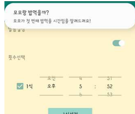
Fig. 5. Push alarm

만약 사용자가 전혀 관련 없는 데이터를 입력한다면 그림 4의 Dialogflow server에 등록되지 않은 말을 받았을 때와 같이 예외처리를 만들고 학습시킨다. 인공지능의 학습 정도를 테스트를 통해 알아보고 예외가 없는지 확인한다. 학습이 끝난다면 알람 기능이 구현된 레시피 챗봇에 연동하여 챗봇이 올바르게 동작하는지 확인한다.