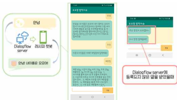
Fig. 4. Chatbot operation process

이 의도를 교육하기 위해 DialogFlow의 intent 항목에 데이터로 들어갈 요리 이름과 기능을 등록한다. 등록된 요리 이름과 기능은 각각 하나의 intent가 된다. 만약 같은 의미가 있거나 유사한 단어는 각 intent 내부에 추가로 등록해준다. 의도에 해당하는 ‘답변’을 출력시키기 위해 각 intent를 입력받았을 때의 동작으로 그림 3과 같이 해당하는 데이터(요리 레시피 및 추천 리스트)를 입력해준다. 같은 방법으로 추천 및 인사말을 입력하되 사용자가 추천 기능을 이용할 때는 한식, 양식, 중식, 일식, 간식 이란 의도를 입력하면 해당하는 리스트에서 무작위로 요리명을 출력하도록 한다.